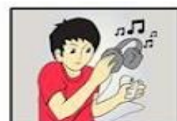
Listen to music