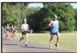
Run in the Park