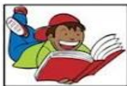
Read a Book