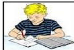
Study for test

6. En las siguientes oraciones señala cual es la forma correcta de utilizar el verbo.