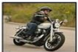
Ride a Motorcycle