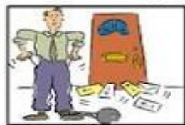
Pay the bill