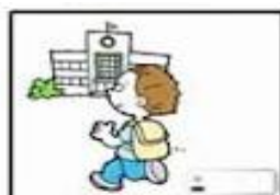
Go to school